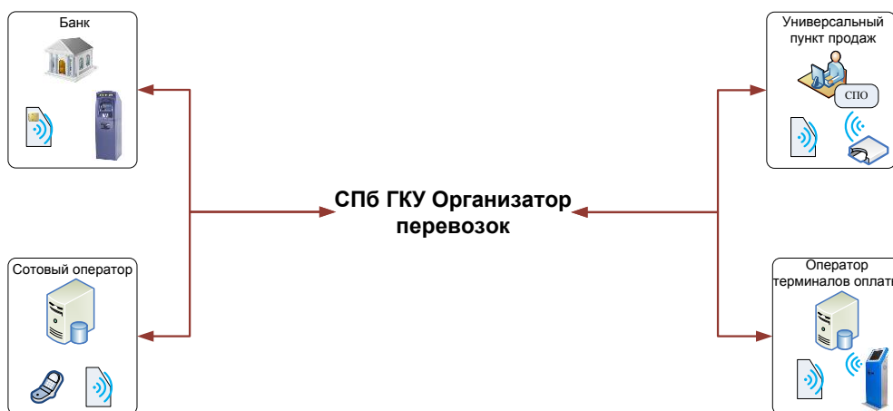
Рис.1 Общая схема реализации ПБ.

Основой схемой реализации ЕЭБ является программно-аппаратный комплекс Организатора, осуществляющий онлайн-обработку запросов на отложенное пополнение от Оператора и осуществляющий учет проводимых операций.