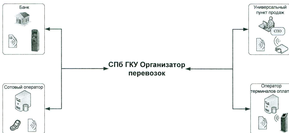
Рис.1 Общая схема реализации ПБ

Основой схемой реализации ПБ является программно-аппаратный комплекс Организатора, осуществляющий онлайн-обработку запросов на реализацию ПБ от Оператора и осуществляющий учет проводимых операций в соответствии с Рис. 1.