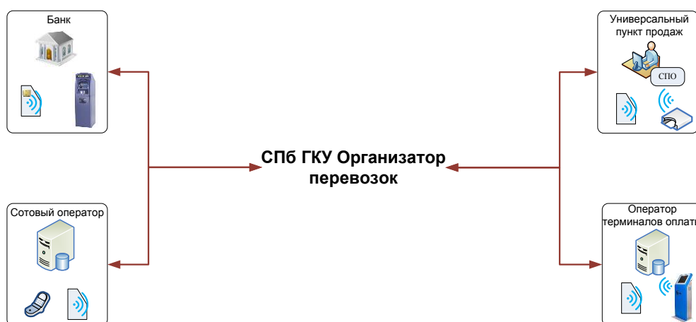
Рис.1 Общая схема реализации ПБ

– обеспечить обмен данными с Организатором в соответствии с Федеральным законом от 27.07.2006 №149-ФЗ «Об информации, информационных технологиях и о защите информации» и от 29.07.2004 № 98 Федеральным законом «О коммерческой тайне».